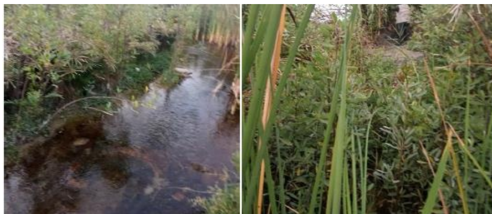
FIGURA N°03: SE OBSERVA SEDIMENTACIÓN E INCREMENTO DE MALEZA, DE IGUAL FORMA, SE TOMARON PUNTOS Y VERIFICÓ LA NECESIDAD DE LA CONFORMACIÓN DE DIQUES CON MATERIAL PROPIO, ESTO CON EL HECHO DE EVITAR POSIBLES DESBORDES EN MAXIMAS AVENIDAS.