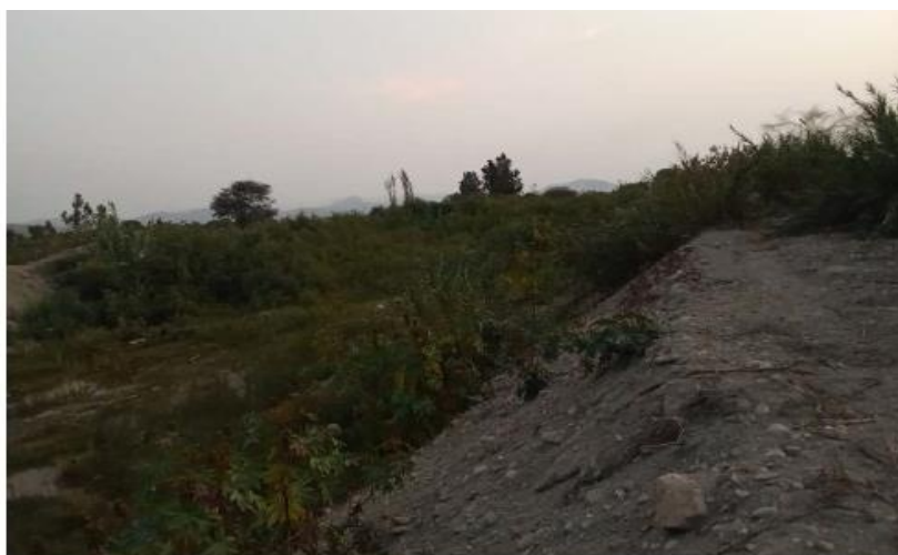
FIGURA N°01: TRAMO CRÍTICO EN EL RIO HUAMANZANA, SECTOR HUASQUITO, EN LA CUAL SE EVIDENCIA LA PRESENCIA DE MALEZA EN LA CAJA INTERIOR DEL RIO HUAMANZANA, VERIFICANDO LA EXISTENCIA DE BORDES EN TRAMOS DEL MARGEN DERECHO E IZQUIERDO, CON MATERIAL PROPIO.